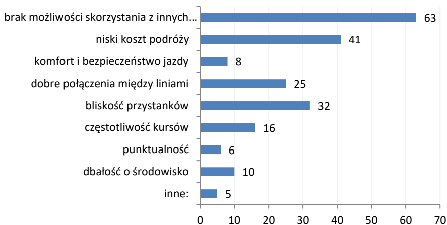
Rys. 1. Główne przyczyny wyboru transportu miejskiego

Respondenci poproszeni zostali o określenie przyczyn wyboru transportu publicznego, jako środka lokomocji. Najczęstszymi z nich, w opinii respondentów, są: brak możliwości skorzystania z innych formy transportu (brak własnego samochodu, brak uprawnień, niezdolność do prowadzenia pojazdów, itp.), niski koszt podróży, bliska odległość do przystanków oraz dobre połączenia między liniami. Nie wielu mieszkańców wskazało na komfort i bezpieczeństwo jazdy oraz punktualność przyjazdów autobusów. Może to być zatem obszar, który należy udoskonalić w transporcie miejskim. Na rysunku 1 przedstawiono odpowiedzi ankietowanych w tym zakresie.