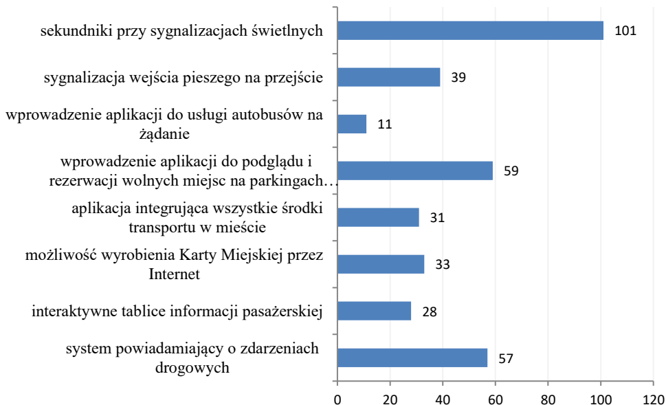
Rys. Błąd! W dokumencie nie ma tekstu o podanym stylu.. Propozycje nowych rozwiązań telematycznych w transporcie miejskim i ich potrzeba wdrożenia w ocenie respondentów