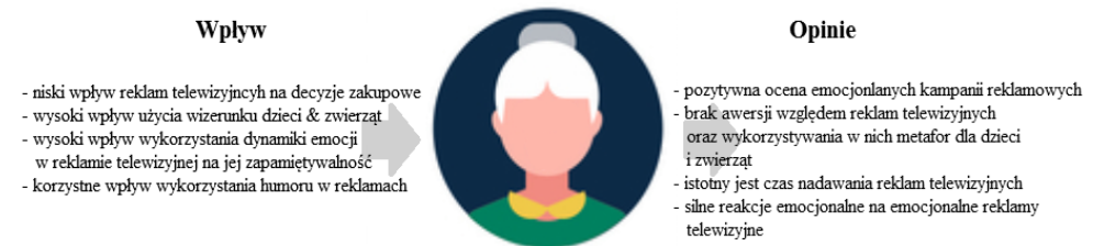
Rys. 1. Najważniejsze czynniki wpływające na Kobiętę numer 1 oraz jego opinie na temat reklam telewizyjnych

Wypowiedzi poszczególnych respondentów zostały zaprezentowane w postaci poglądowych ilustracji ukazujących wpływ reklam emocjonalnych na podejmowane przez nich decyzje zakupowe oraz opinie jakie wyrazili oni na ich temat.