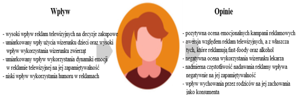
Rys. 3. Najważniejsze czynniki wpływające na Kobiętę numer 2 oraz jej opinie na temat reklam telewizyjnych

Badany mężczyzna (patrz rys. 2) wykazał mały zasób wiedzy na temat reklam telewizyjnych oraz wykorzystywanych w nich metod. Nie potrafił on również przywołać przykładów reklam co wskazuje na czasem niską skuteczność docierania do podświadomości odbiorców. Respondent przede wszystkim doceniał fakty oraz techniczne aspekty przekazów. Tak jak Kobieta 1 uznał on, że reklamy telewizyjne powinny przede wszystkim oddziaływać społecznie.