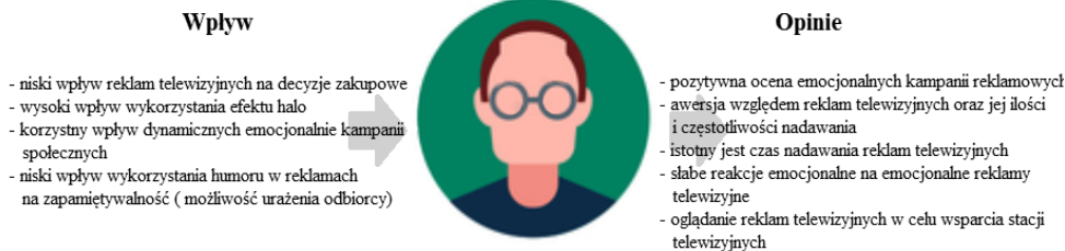
Rys. 2. Najważniejsze czynniki wpływające na Mężczyznę numer 1 oraz jego opinie na temat reklam telewizyjnych