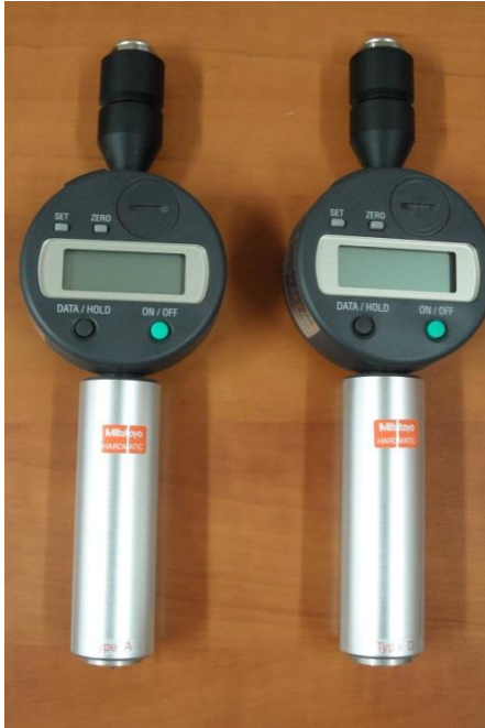
Rys. 3. Durometry Shore A i D

W badaniu twardości materiałów o niezbyt wysokiej twardości (np. gumy i tworzyw sztucznych) często stosowana jest metoda Shore. Istnieją dwie metody Shore'a – metoda skleroskopowa – (dynamiczna) polegająca na pomiarze wielkości odskoku bijaka uderzającego powierzchnie badanej próbki, bądź metoda duroskopowa – polegająca na wciskaniu identora w badany materiał siłą charakterystyczną dla określonego przyrządu do uzyskania stanu równowagi. Istnieją różne skale Shore, stosowane do materiałów miękkich – skala A, bądź bardziej twardych – skala D.