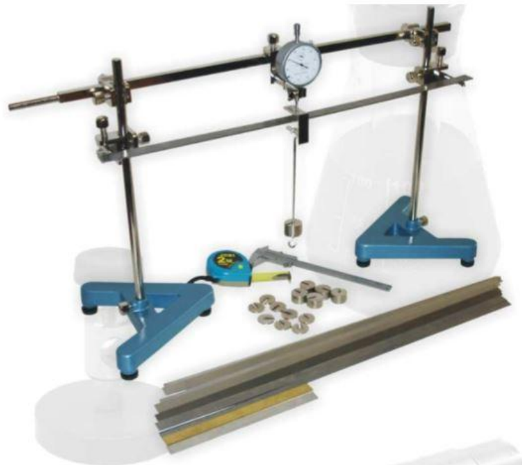
Rys. 3. Stanowisko do wyznaczenia modułu Younga metodą zginania pręta

Strzałkę ugięcia mierzymy przy pomocy odpowiedniego czujnika zegarowego, którego trzpień stykamy z górną częścią strzemiączka. Czujnik montowany jest na belce łączącej obie podpory (rys. 3).