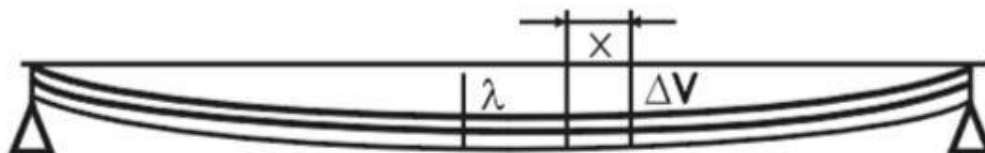
Rys.1. Wygięty pręt umocowany na końcach

Pręt umocowany na końcach pod wpływem własnego ciężaru lub pod obciążeniem ulega wygięciu. W górnej warstwie pręta następuje ścisnięcie, a w dolnej rozciąganie materiału pręta. Cienka warstwa środkowa nie ulega ani ścisnaniu ani rozciąganiu i tworzy warstwę „ obojętną ”. Przy dostatecznie małym obciążeniu, wydłużenia dolnej warstwy i ścisnięcia górnej podlegają prawu Hooke’a .